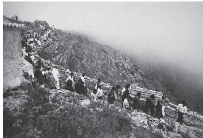
FOTO 14 – Caminho da Santa Cruz em Monte Santo

Apesar de em algumas fotos haver um destaque no primeiro plano para uma ou duas pessoas (fotos 16 e 17), o fotógrafo ao optar pela objetiva grande-angular mantém o fundo em evidência também, onde há pessoas. Com isso, deixa mais clara a opção em ressaltar o coletivo. O que parece interessar a ele neste momento é mostrar o ritual religioso que só se mantém há mais de 200 anos nesta formatação, devido a imensa participação do povo sertanejo. Daí os planos mais abertos, mantidos em alguns momentos pela distância e em outros pelo recurso técnico da grande-angular.