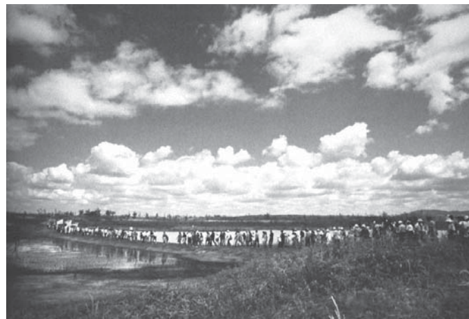
FOTO 19 – Romaria pelos Mártires de Canudos