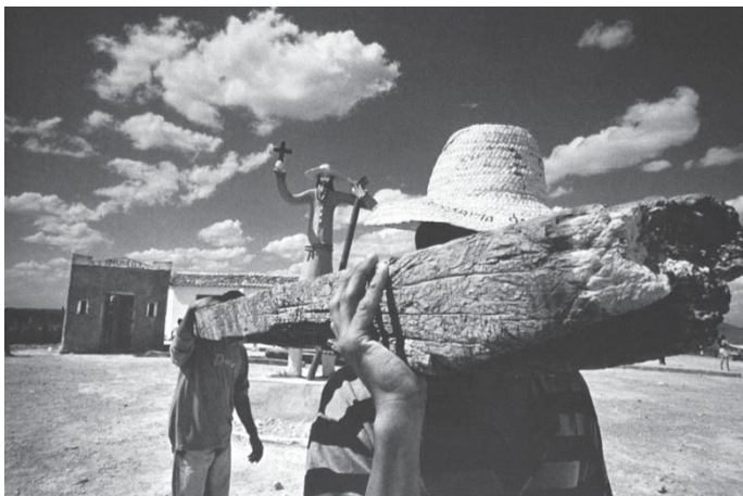
FOTO 12 – Esteio que sustentou a igreja de Canudos