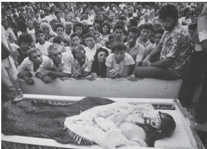
FOTO 15 – Semana Santa em Monte Santo