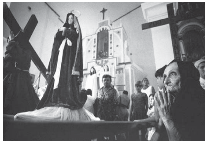
FOTO 17 - Semana Santa em Monte Santo