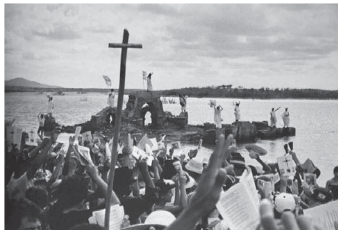
FOTO 20 – Romaria pelos Mártires de Canudos