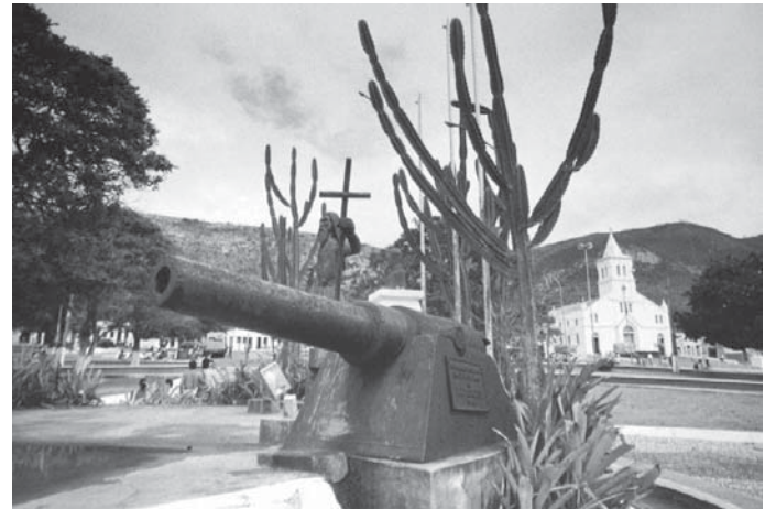
FOTO 31 – Canhão em praça pública