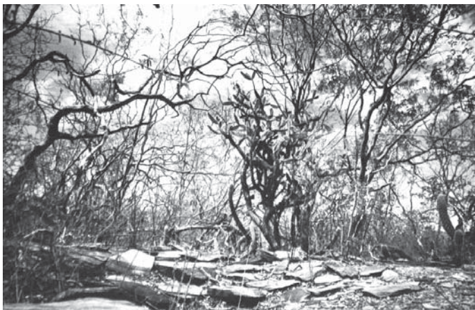
FOTO 32 – Resquícios de trincheiras