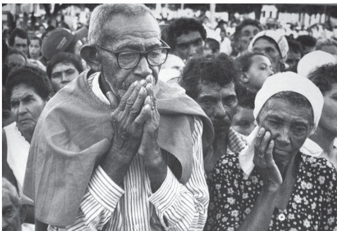
FOTO 16 – Semana Santa em Monte Santo